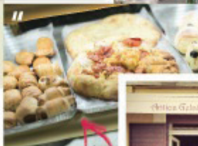
El Focacciaro Pizze irresistibili!