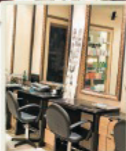
Parrucchiere Giuseppe: il mast dei tagli di tendenza