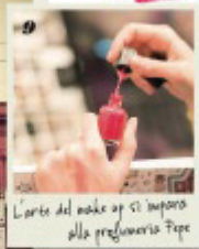
L'arte del make up si ispira alla profumeria Pepe